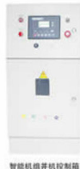
智能机组并机控制箱